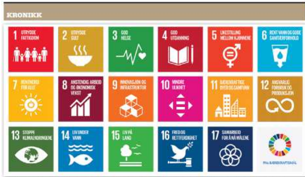
Nå jobber det over hele landet med å lage bærekraftstategier. Agder definerer våre mål gjennom regionplan Agder 2030, som er 17 bærekraftsmål, skriver Tone Sundt.