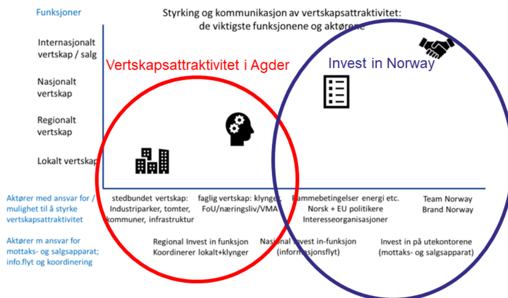
Figur 1: De viktigste aktørene i arbeidet med å styrke og kommunisere Vertskapsattraktivitet (Invest in Norway/Agder fylkeskommune)

ressurser med relevant kompetanse for å støtte gjennomføringen. Å arbeide med vertskapsattraktivitet stiller krav til at det arbeides systematisk på ulike nivåer. Forutsetningen for å lykkes i arbeidet opp mot internasjonale aktører, er at samarbeidet mellom Invest in Norway og vertskapsarbeidet i Agder er godt koordinert i de ulike oppgavene og funksjonene – se figur 3 under.