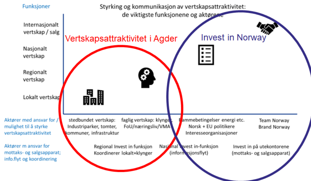
Figur 3: De viktigste aktørene i arbeidet med å styrke og kommunisere Vertskapsattraktivitet (Invest in Norway/Agder fylkeskommune)

Samtidig som det nasjonale nivået er viktig, er det også avgjørende at det lokalt og regionalt gjøres et godt arbeid. Erfaringene fra Nord-Sverige viser blant annet at i lokalsamfunn og regioner hvor det er nært samarbeid om vertskapsattraktivitet oppnår man gode resultater.